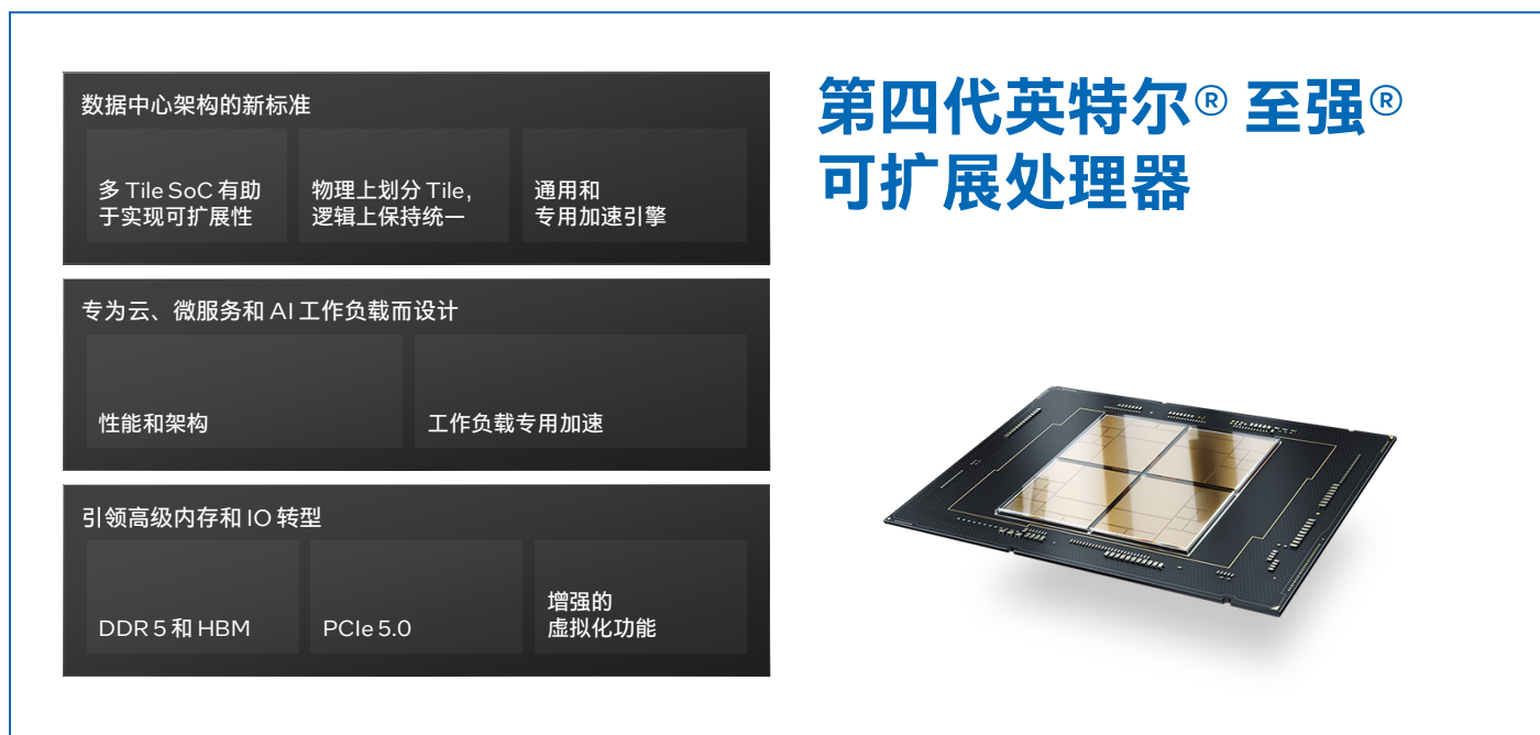
图 1. 第四代英特尔® 至强® 可扩展处理器

第四代英特尔® 至强® 可扩展处理器在 AI 性能上更进一步。该处理器内置了创新的英特尔® AMX 加速引擎。英特尔® AMX 针对广泛的硬件和软件优化，它进一步增强了前代技术 — 向量神经网络指令 (VNNI) 和 BF16，从一维向量发展为二维矩阵，以便最大限度地利用计算资源，提高高速缓存利用率，以及避免潜在的带宽瓶颈，显著增加了人工智能应用程序的每时钟指令数 (IPC)，可为 AI 工作负载中的训练和推理提供显著的性能提升。